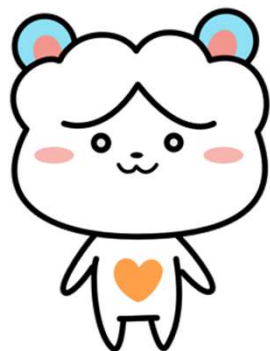
マスコットキャラクター ハトるん