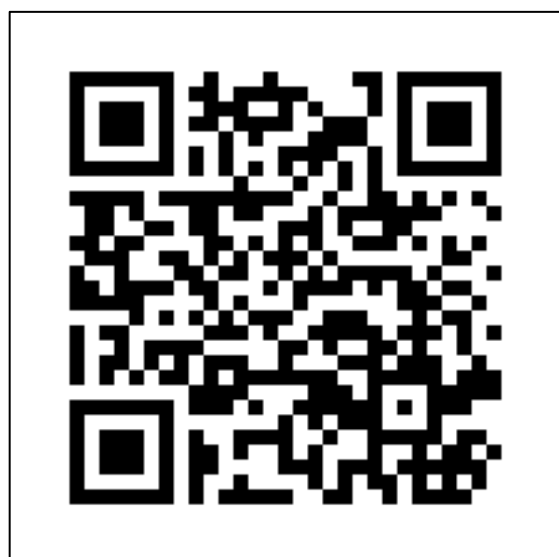
岐阜大学皮膚科教室