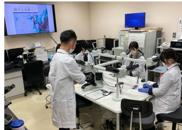
* 病理部にて細胞診標本のスケッチの体験中

当日は県内の高校生約15名が参加し、施設見学や医療職体験、zoomを使った遠隔医療体験などを行いました。参加者からは、職業体験するごとに歓声が起こり、医療への興味や関心の高まりが感じられる有意義な取り組みであったと感じました。