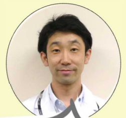
ソーシャルワーカー

治療内容や治療による副作用などの相談をお受けいたします。普段なかなか聞けないことやいままら聞けないことなどお気軽にご相談ください。