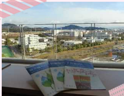
図書室から金華山の眺めは最高