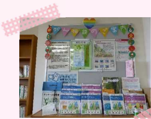
院内図書室クリスマスの様子

がん相談支援センターは、がんという病気について、その治療や療養、気持ちのつらさなどのご相談をお受けし、どなたでも利用することができる窓口です。患者さん、ご家族はもとより、より多くの方々にがん相談支援センターを知ってもらい、がんに関する情報を十分に提供するため、院内図書室に情報コーナーを設け、がん相談支援センターやがん関連図書のご案内をしています。季節のイベントごとにデコレーションをするなど、利用しやすい雰囲気づくりにも心がけていますので、院内図書室へぜひお立ち寄りください。がん相談支援センターは病院 1 階の医療連携センターにあります。まず、あなたの気持ちや思いに耳を傾けることから支援を始めます。お気軽にお問合せください。【電話】058-230-7049